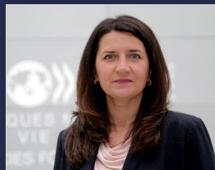
Ivita Burmīstre , Latvijas vēstniece Ekonomiskās sadarbības un attīstības organizācijā

OECD sniedz uz datiem un pierādījumiem balstītus ieteikumus politiku uzlabojumiem. Man ir patīams prieks redzēt, kā Latvijas pārstāvji strādā, lai ieviestu OECD ieteikumus Latvijās ekonomiskās izaugsmes, konkurētspējas un iedzīvotāju dzīves līmeņa uzlabošanai.