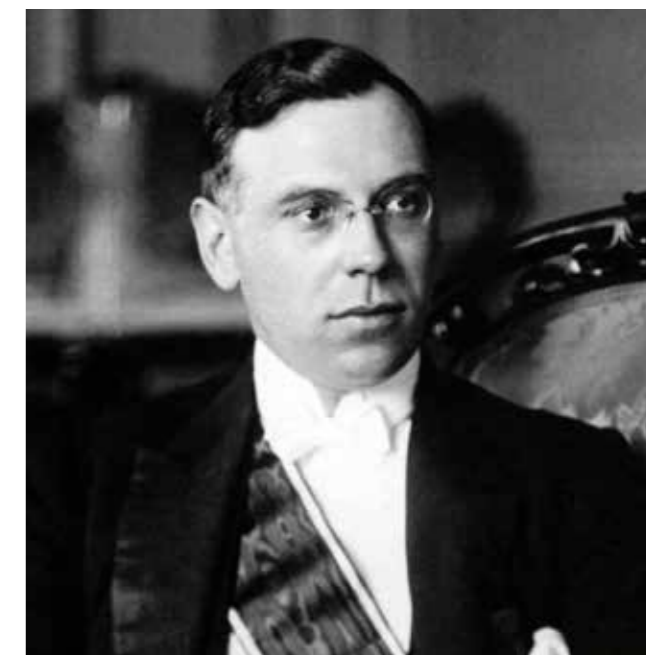
Zigfrīds Anna Meierovics

"1917. gadā Rīgā vēl nenoteikti runāja tikai par autonomiju. Neatkarīgās Latvijas zvaigzne uzlēca Valkā, kur vēlā rudenī sanāca Latviešu Nacionālā padome, lai izteiktu protestu pret Kurzemes pievienošanu Vācijai un pasludinātu, ka Vidzeme, Kurzeme un Latgale ir nedalāmas, neatkarīgas valsts vienība, kuras iekārtu noteiks Latvijas Satversmes sapulce. Tā bija pirmā Latvijas pasludināšana," 1920. gadā piezīmēs ar nosaukumu "Latvijas iecerēšana" rakstīja Kārlis Skalbe 1 .